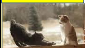
Nach der Wahl